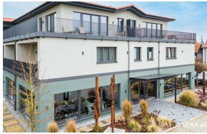
Neuer Anziehungspunkt für Gäste: Erholung trifft auf automobiler Akzente