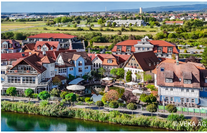
Vier-Sterne-Superior-Hotel mit einzigartigem Dorf-Charakter: das Seehotel Niedernberg