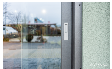
Highlight zum Anfassen: die Dekorfolierung in Alux DB 703 mit Eisenglimmer-Effekt