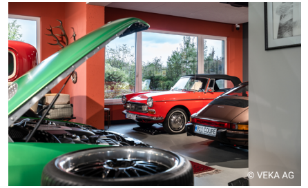
Hingucker im Erdgeschoss: das Automobilmuseum mit seinen 11 historischen Fahrzeugen