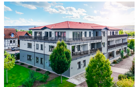
Neuzugang im Ensemble: die Villa MainTraum mit Gästezimmern, Penthouse-Suiten und Automobilmuseum