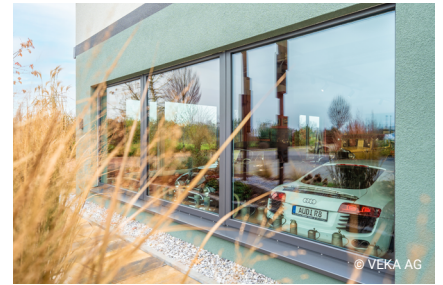
Ein- und Ausblicke gewähren: bis zu 6 Meter breite Fensterelemente im Museumsbereich

Um die Bedienung der teilweise 3-spurigen Hebeschiebetüren möglichst barrierefrei zu gestalten, kommen verlängerte Drehgriffe und besonders leichtgängige Getriebeausführungen mit angepasstem, niedrigem Griffsitz zum Einsatz. So kann gewährleistet werden, dass selbst größte Fenster und Schiebetüren einfach bewegt werden können. Die barrierefreien Anschluss- und Schwellenzubehöre von VEKA leisten hierfür einen wichtigen Beitrag.